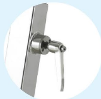
Réglages rapides Click & Turn