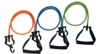
ÉLASTIQUES 3 RÉSISTANCES AU CHOIX