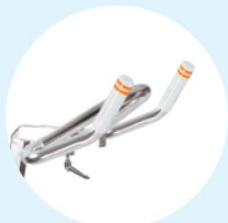
Guidon Sport 45°