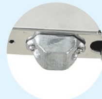
Anode sacrificielle pour usage marin