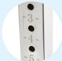
Réglages gradués précis