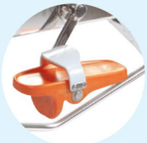
Confort pieds nus

Le système Aquapalm 2 du WR4 est constitué de 4 ailettes orientables pour augmenter la performance. La forme de godet offre un appui supplémentaire sur l'eau et un surcroit de résistance, ce système de résistance hydraulique est modifiable par l'utilisateur en effectuant une rotation de chacune des ailettes depuis la position assise. Ce progrès technique a séduit clubs de sport, kinésithérapeutes et centres de thalassothérapie.